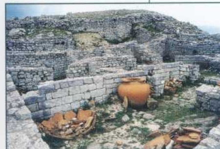
Sambuca di Sicilia Scavi di Adranone

Mettere in un tegame il burro e metà di scorza d'arancia grattugia- ta, lasciar riscaldare, quindi, aggiungere sale, pepe, succo d'a- rancia e panna. Lessare al dente le linguine, versarle nel tegame ed amalgamare a fuoco medio per qualche minuto; spegnere ed aggiungere il parmigiano. Servire nei piatti, decorando il risotto con la scorza d'arancia.