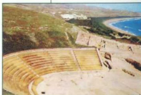
Eraclea Minoa Teatro greco

Togliere l'umore in eccesso e condire le alicci con l'olio extravergine di oliva ed il prezzemolo fresco tritato finemente.