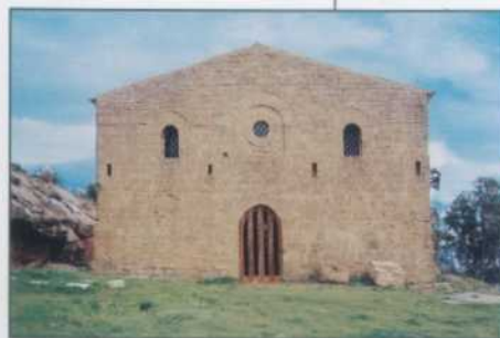
Agrigento San Biagio

Tagliare a fettine sottili la cipolla ed i peperoni, rosolare per qualche minuto in un tegame con olio, sale e peperoncino. Soffriggere il pomodoro già spellato e tagliato a cubetti. Far cuocere tutto per circa mezz'ora, condire con il peperoncino e le farfallette cotte a parte. Spegnerlo dal fuoco ed aggiungere il basilico, i formaggi a scaglie ed i fiocchetti di ricotta.