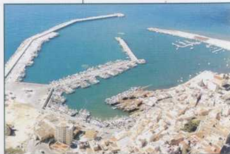
Sciacca Vista del Porto

In una terrina mescolare tutti gli ingredienti, tranne l'olio; pennellare quattro stampini di carta stagnola con l'olio (in alternativa si può usare anche il burro); versare in ognuna un quarto del composto ed infornare a 180°C per circa 20 minuti. Decorare a fantasia e servire le forme ancora tiepide dopo averle tolte dagli stampini.