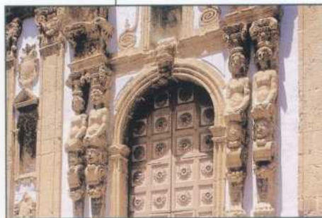
Naro portale barocco

riscaldare la cipolla tritata nel o caldo, aggiungere il riso e o tostare, bagnare con il vino ed ngare pian piano con il brodo. A tà cottura aggiungere la scorza rancia e la salsiccia sbriciolata e rosolata. Quasi a cottura ulti- ta aggiungere le noci tritate, liere dal fuoco e mantecare con parmigiano. Decorare, infine, il tto con i filetti di arancia, parmi- no e prezzemolo.