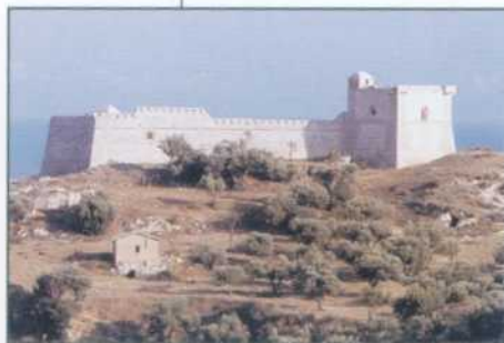
Licata Castel Sant'Angelo

Lasciar cuocere i pomodori e passarli al passatutto; lessare i cavatelli e versarli nella salsa bollente, lasciar cuocere per qualche minuto affinché il tutto si restringa. A fuoco spento aggiungere le strisciole di melanzane già fritte, il pecorino grattugiato e la mozzarella tagliata a cubetti. Servire con foglie di basilico fresco.